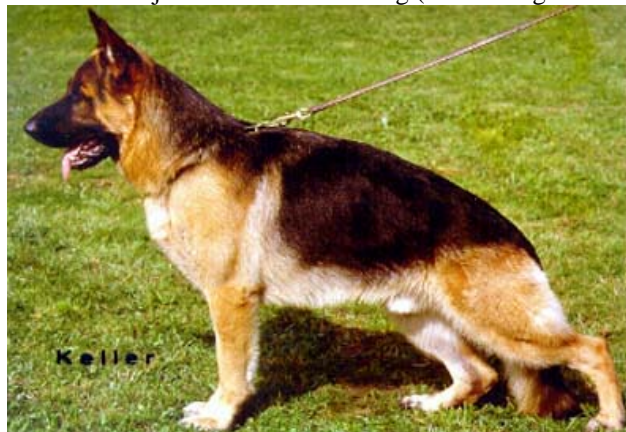
DÖRIJAN VOM YOHANESS BERG

Un hijo de Uran von Wildsteiger Land, llamado Kalle von der Noriswand con Eike vom Neuen-Berg ( hija de Enzo von der Burg Aliso - Quando von Arminius ) y a su vez madre de Lasso vom Neuen-Berg VA1 1997 , da a Gandi vom Heilbronner Schloss, que a su vez cruzado con Ola vom Yohanness Berg ( hija de Gino vom Messebau - Enzo Burg Aliso y con línea materna Mutz ), da como resultado a Dörijan vom Yohanness Berg ( Enzo Burg Aliso 3-3 ).