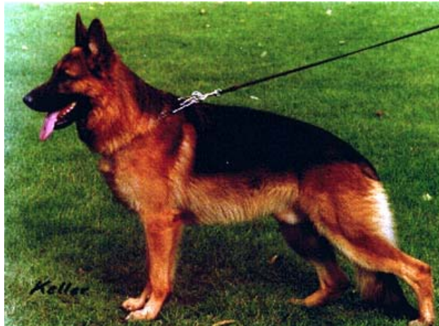
KALLE V.D. NORISWAND

Un hijo de Uran von Wildsteiger Land, llamado Kalle von der Noriswand con Eike vom Neuen-Berg ( hija de Enzo von der Burg Aliso - Quando von Arminius ) y a su vez madre de Lasso vom Neuen-Berg VA1 1997 , da a Gandi vom Heilbronner Schloss, que a su vez cruzado con Ola vom Yohanness Berg ( hija de Gino vom Messebau - Enzo Burg Aliso y con línea materna Mutz ), da como resultado a Dörijan vom Yohanness Berg ( Enzo Burg Aliso 3-3 ).