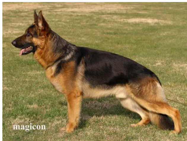
NANDO VOM STILLEN MOOR

-Nando vom Stillen Moor, su madre es hija de Gorbi vom Abtei-Eck - Lux de Valdovin.