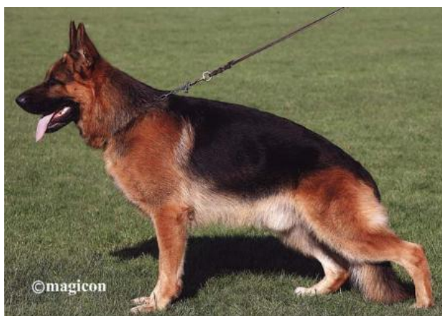
ODIN VOM HOLTKÄMPER HOF

-Hoss con la reproductora Lea vom Haltkämper See ( hija de Max della Loggia dei Mercanti - Visum von Arminius VA1 1996 ) con Perle vom Salzgitter Milieu ( hija de Hanno Wienerau - Jello Wienerau ), daría al reproductor Yak vom Frankengold, consanguinidad 4-5 Anett Noricum, 5,5-5,5 Uran 5,5-5,5 Fedor Arminius. Yak es el padre del sieger en clase Muy Jóvenes Machos 2005, Odin vom Holtkämper Hof, su madre hija de Wallace aus Agrigento - Scott Deodatus - Gusti Wildsteiger Land - Jeck Noricum, es Riska vom Holtkämper see ( 4-5 Mark Haus Beck ).