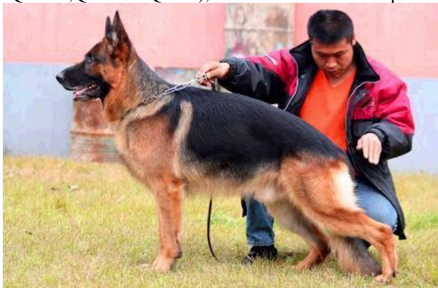
YACK V. FRANKENGOLD

-Dörjjan con Tina von Arminius ( hija de Tenno von Noricum - Mark von Haus Beck con Anett von Noricum ( madre de Jeck von Noricum VA1 1993 ), consanguinidad de Tina: 3-3 Fedor Arminius, 3-4 Uran Wildsteiger Land, daría a Hoss vom Lärchenhain ( consanguíneo 5,5-5 Quando,Quando - Quina ), manteniendo la fuerza que transmite la superlativa cría "Q".