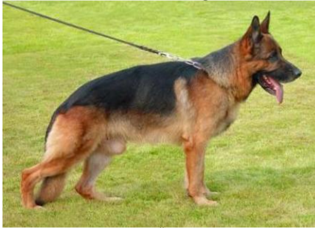
HOSS VOM LÄRCHENHAIN

-Los resultados en el sieger Alemán 2005 , demuestran el potencial de ésta línea, desarrollándose paralelamente a lo que sucedía con la otra línea de Uran von Wildsteiger Land VA1 1984-1985, la de Ulk - Rikkor( que nos mantuvo entretenidos a todos ), se fue formando ésta línea desconocida hasta hace poco de Uran, al menos para la gran mayoría de los aficionados de todo el mundo, que hoy tiene gran protagonismo, gracias al reproductor Yak vom Frankengold, hijo de Hoss.