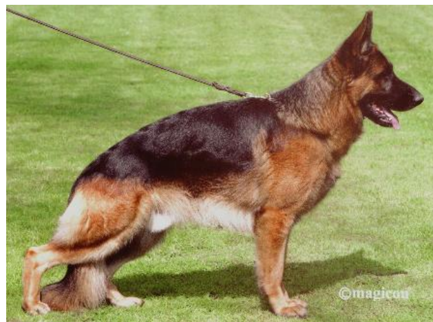
IDOL VOM HOLTKÄMPER HOF

-Idol vom Holtkämper Hof, su madre es Ginga vom Kristallsee - Lord vom Georg Vektor Turm - Jeck Noricum.