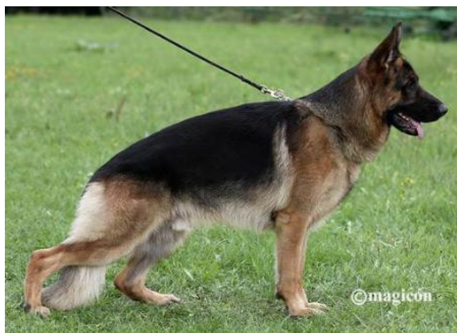
ILBO VOM HOLTKÄMPER SEE

-Ilbo vom Holtkämper See SG13 2DA 2005, hijo de Edna Holtkämper See - Pascha Jahnhöhe - Idol Jahnhöhe - Ulk von Arlett.