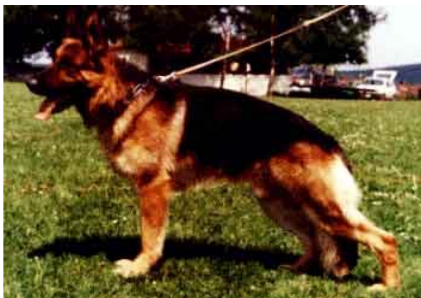
JUPP HALLER FARM

-Analizando la consanguinidad de Jupp, vemos cómo se va fijando el "tipo" determinado. El 4-4 en Gero ( padre de la madre de Mutz ), y el 4-4 en Vello zu den Sieben Faulen - línea directa de Rolf, hace que la línea empuje hacia las generaciones venideras un equilibrio determinado entre las dos líneas principales.