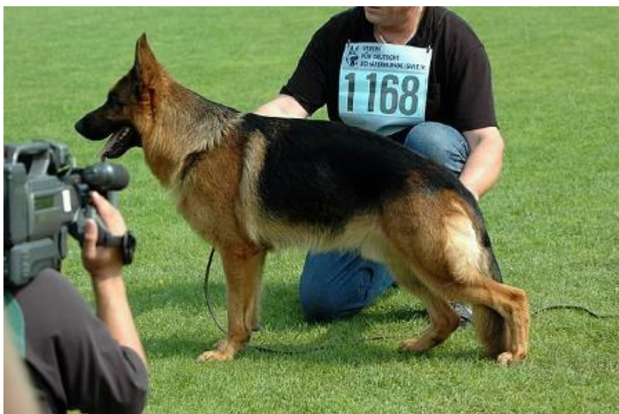
DUX DE CUATRO FLORES

Hill-Ursus / Eros-Zamb-Jeck-Ulk / Natz-Quina, Quana, Quando / Jupp-Quanto / Jonny-Vello / Alf-Rolf, en fin, volvemos al principio, donde hay un indudable funcionamiento y compatibilidad de la línea con las otras dos.