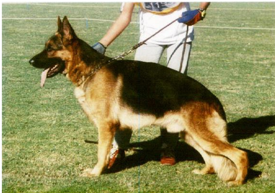
SIUX VOM TENDRESSE

-En Argentina la línea Mutz también fué compatible con la línea Uran ( dando a Bull der Watchhund ), y con la de Visum Arminius dió a Solo von Sprinteen y Viador von Kisman.