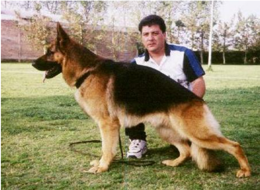
BULL DER WATCHHUND